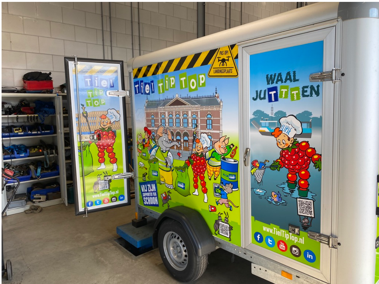
Figuur 2: v.l.n.r. Beeldmerk/logo Tiel Tip Top, Campagne "Maak Jij Het Verschil" en Campagne WaaljuTTen

Op speelse wijze hebben alle panelen een QR-code meegekregen die gescand kunnen worden met een smartphone. Eenmaal gescand word je doorverwezen naar een landingspagina op onze website en daar zullen vanaf dit voorjaar video's te zien zijn die de verhalen achter onze campagnes en ons vrijwilligerswerk vertellen. Je hoeft je dus niet te vervelen als je iets te vroeg ben aangekomen bij onze opruimacties. We hebben dit idee afgekeken in musea en exposities en het bedachte systeem werkt.