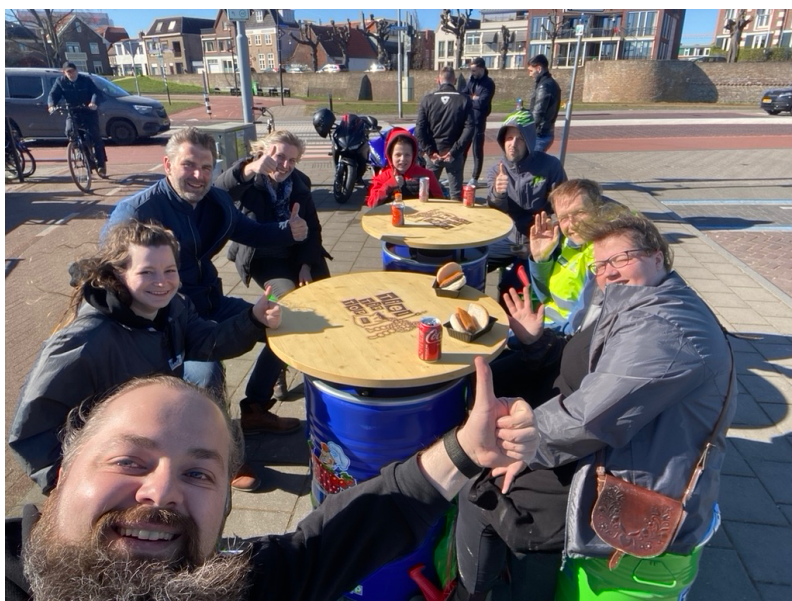
Figuur 5: Ons straatmeubilair in actie tijdens een schoonmaakactie langs de rivier.

We zijn als werkgroep bezig om een gezelschapsspel te ontwikkelen die het voor deelnemers makkelijker moet maken om met anderen aan tafel in contact te komen. Je zou hierbij aan het concept van een “Kletsplot” kunnen denken. Dit spel krijgt een -in het oogspringend- speelbord dat we de picknicktafels willen laten drukken. Net als bij de bestelling van de Mastertenten vraagt dit tijd en energie van onze werkgroepleden, dus dit (aanvullende) deel van het project zullen we in het voorjaar 2023 gaan realiseren. In ieder geval ruim voordat we weer lekker met onze deelnemers naar buiten kunnen.