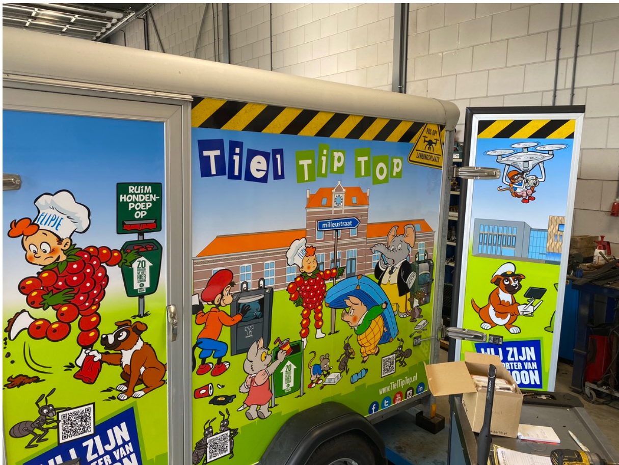
Figuur 3: v.l.n.r. Campagne "Hondenkak", Operation G.A.R.B.A.G.E. en Drone Divisie

Op het dak van onze Samenhangen hebben we een heliplatform aangebracht met de letter "D" van drone. Het OranjeFonds had ons aangegeven te zullen meefinancieren aan ons projectplan Samenhangen, maar dat het onderdeel van onze Drone Divisie hier helaas niet in paste. Hierop hebben we 4 bedrijven gevonden die ons hebben geholpen dit deel van het project te financieren. Hierover vertellen we meer in het laatste hoofdstuk van dit document. We wilden rondom de Samenhangen geen bedrijfsreclame aanbrengen en hebben het voor onze Drone Partners dus slim op weten te lossen door hiervoor het dak te gebruiken.