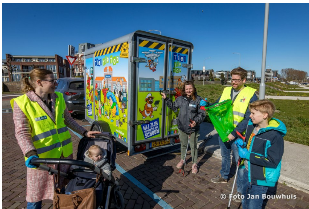
Figuur 6: Eerste keer inzetten van de Samenhang in 2021

Naar schatting hebben we ca. €7500 extra uitgegeven aan de projectrealisatie en in dit bedrag is de tweede Mastertent, de vier picknicktafelsets en de bijbehorende ontwerpkosten nog niet meegenomen. De afronding van deze laatste fase zal in het eerste kwartaal van 2023 gebeuren en wij zijn in staat de kosten hiervoor te dragen. We hopen dat onze partners, Gemeente Tiel, Burgerweeshuis en OranjeFonds met plezier terug kijken op dit project en we zullen komend voorjaar zorgen dat dit project de PR meekrijgt die zij en alle betrokkenen verdienen. En hiermee komen we aan het einde van onze eindrapportage omtrent project Samenhang!