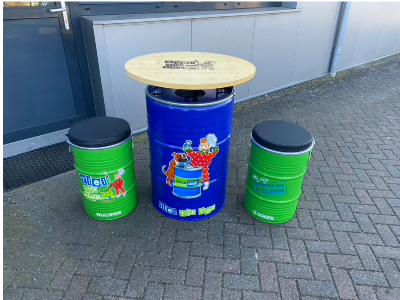
Figuur 4: Eerste indruk van ons straatmeubilair (bedrukking werd later nog aangevuld).

Bij de bestelling van onze Mastertenten gaat Tiel Tip Top zelf nog een flinke investering doen in extra picknicktafels. Deze tonnen zijn natuurlijk super voor in onze Samenhanger, maar op evenementen hebben we toch meer nodig dan alleen dit. Onze organisatie groeit namelijk nog elke dag.