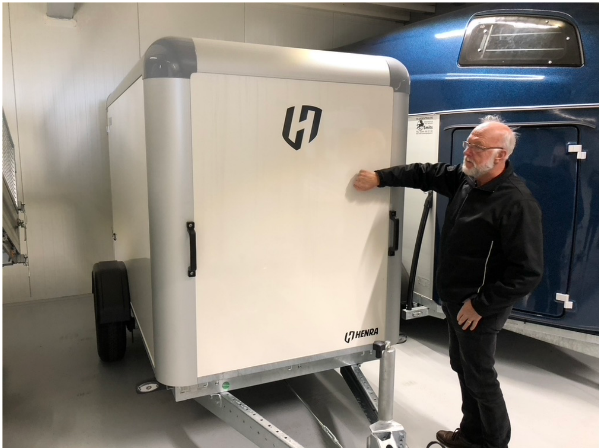
Figuur 1: Samen met mijn vader gingen we onderzoeken welke aanhanger het moest gaan worden.

Na onderzoek en advies wisten we dat het een HENRA aanhangwagen moest worden. De hele familie heeft ons bijgestaan bij het ontwerpen en tekenen van de slimme inrichting. Het familie bedrijf besloot zelfs partner te worden van onze organisatie door jaarlijks een financiële bijdrage toe te zeggen. Uiteraard ging hiermee de opdracht voor het inbouwen van de kasten en de montage van elektra, accessoires en de verschillende transporthulpmiddelen zoals stangen en bevestigingsogen naar dit bedrijf. Wat bijna werd vergeten was een stevige vorkslot tegen diefstal. Onze Samenhanger heeft aan weerszijden zijdeuren gekregen voor het goed en efficiënt opbergen van alle materialen. We willen namelijk niet dat de aankopen onderweg kapot gaan vanwege het transport.